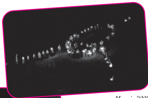
Maggio 2005 Pro Centro Solidarietà Giovani di Udine