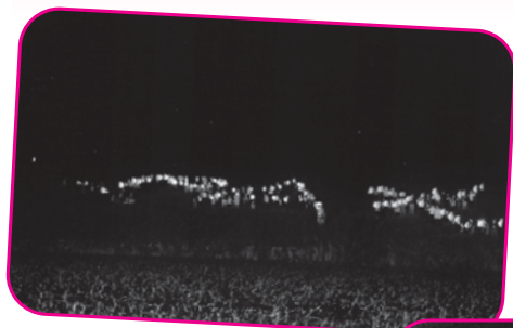
Maggio 2000 Pro Progetto Zuliano 2000 "Un sogno condiviso"