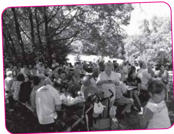
Grigliata campestre Luglio 2009