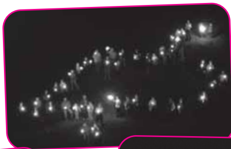
Maggio 2007 Pro Associazione Fabiola