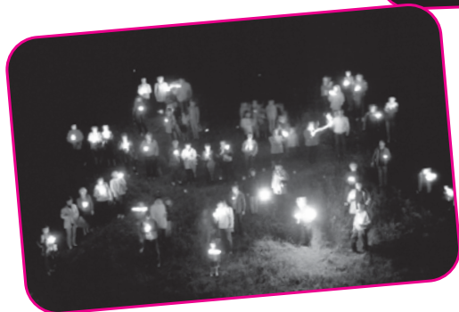
Maggio 2004 - Pro Associazione Luca "Insieme per un sorriso"