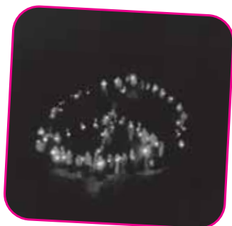
Maggio 2005 - Pro "La Grande Famiglia" di padre Armando Coletto