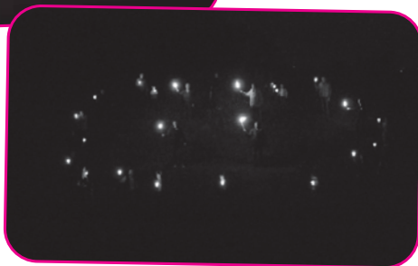
Maggio 2009 - Pro Associazione Afasici del Friuli Venezia Giulia